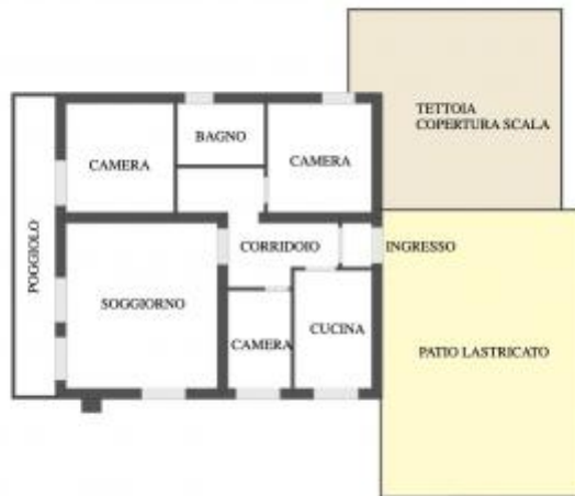
PIANO PRIMO SCALA A VISTA